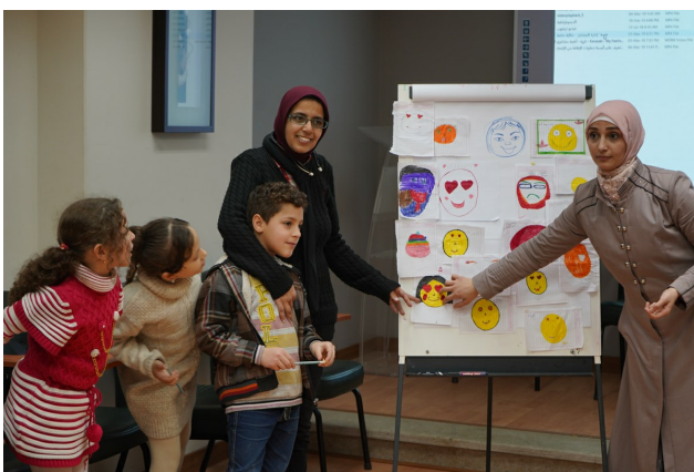
UTBILDNING I EGYPTEN - Här får barnen lära sig att sätta ord på och känna igen olika känslor för att bättre kunna uttrycka dem.