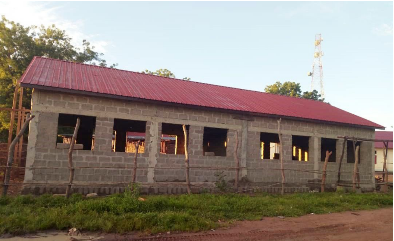
SKOLA I SYDSUDAN - Skolan i Rumbek, nordväst om huvudstaden Juba, kan ta emot 1000 barn.

I dessa arbeten är det möjligt för oss att, i de projektländer där de rätta förutsättningarna finns, sprida information om Akelius digitala utbildningsmaterial. Eftersom det är online kräver materialet dels tillgång till internet och strömförsörjning, dels en smartphone, läsplatta eller dator. Men vi ser att det skulle kunna användas i en del av våra samarbeten.